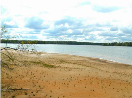
Sääksjärven hiekkarantaa.

Uimavesi on Sääksjärvessä useimmiten ollut hygieeniseltä laadultaan erinomaista ja lähes aina uimiseen soveltuvaa. Hyvälaatuisen veden ja erikoisen luonnonympäristön ansiosta Sääksjärvi ranta-alueineen soveltuu erinomaisesti uimiseen, kalastukseen ja muuhun virkistyskäyttöön. Järven rannoilla on runsaasti vapaa-ajan asutusta ja muuta haja-asutusta sekä useita leirikeskuksia ja julkisia laitoksia. Sääksjärvi ympäristöineen rakennettuja alueita lukuun ottamatta kuuluu suojeltuun Natura-alueeseen.